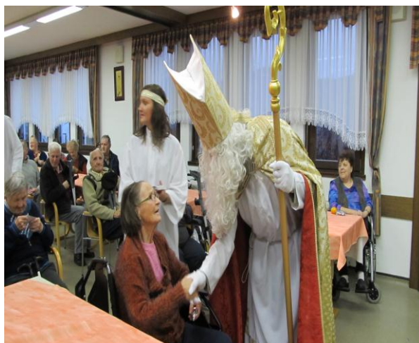
Obisk sv. Miklavža