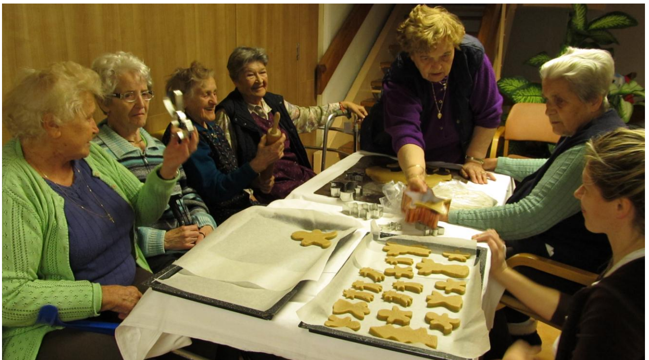
Prijetno popoldne ob peki piškotov in druženju stanovalcev, zaposlenih, naših upokoјencev, otrok zaposlenih ...