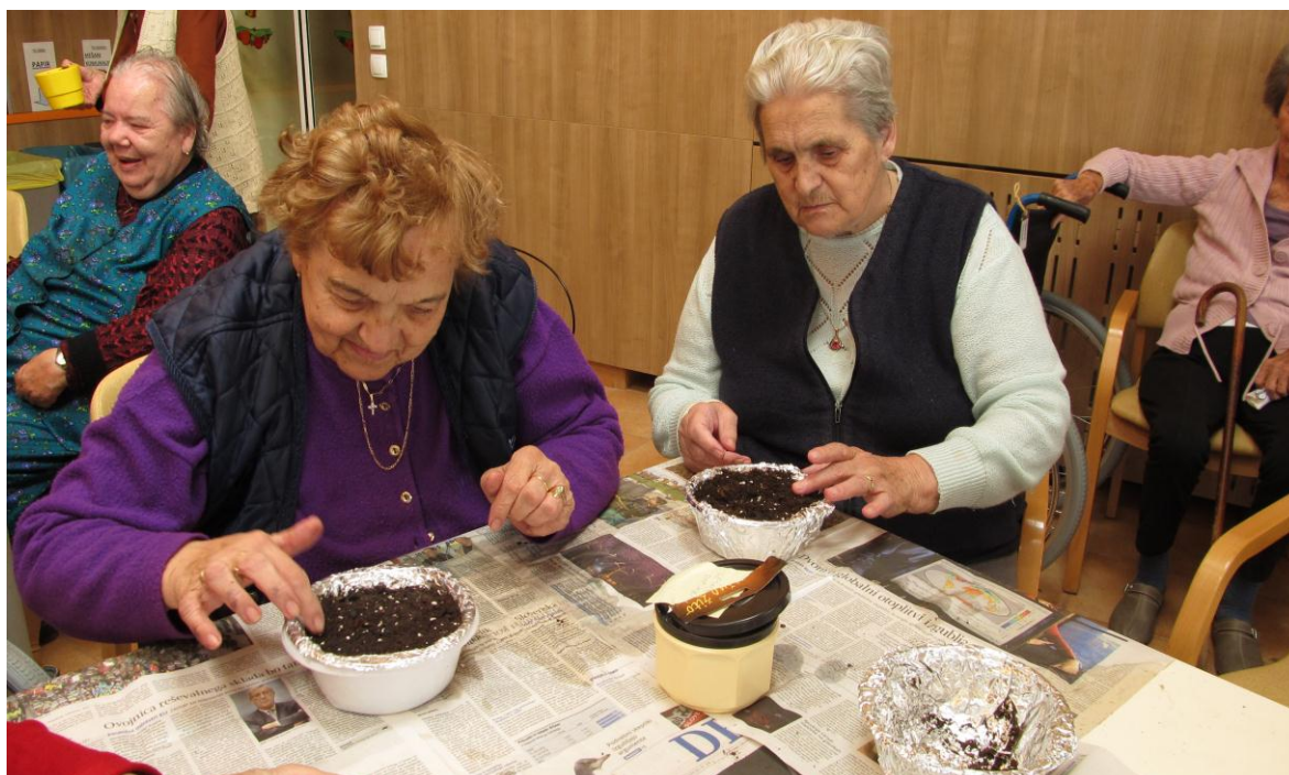
Sejanje božičnega žita